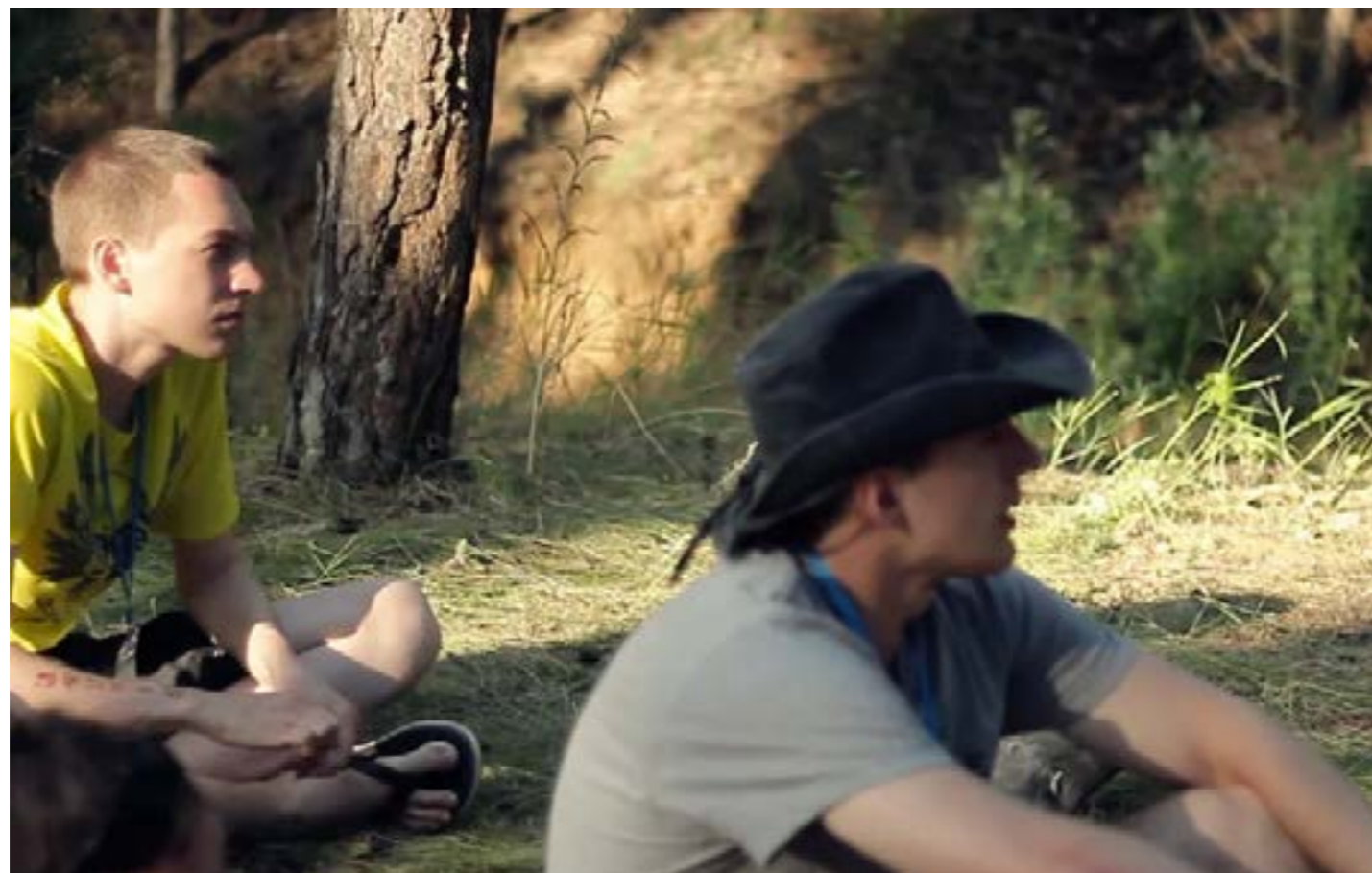
Официальное видео конференции: