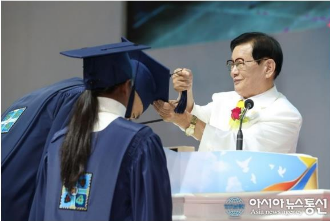
10만 수료식을 진행하는 이만희 총회장.

신천지는 "성경 속의 교훈이나 역사에 치중한 기성 교회의 성경 가르침과는 달리 성경에 약속된 예언이 무엇이며, 예언이 이뤄지는 실상을 수강생들이 직접 확인하도록 하는데 교육의 초점을 맞추고 있다. 이는 종교계에 신앙관의 근본적인 변화를 예고하는 대목이다"고 설명했다.