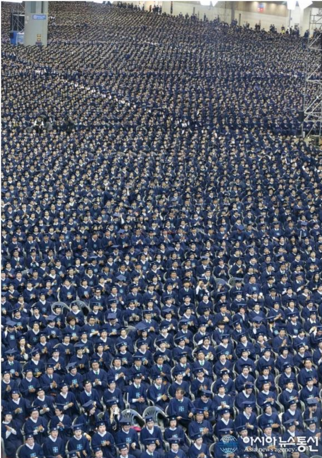
수료식에 참석한 '10만 수료생' 모습.

수료식은 신천지예수교회가 운영하는 무료 성경교육기관인 시온기독교선교센터의 6개월 과정을 마치고 새신자로 정식 등록되는 중요하고 의미 있는 절차다.