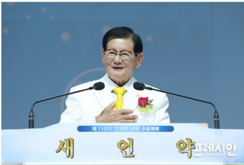
▲이만희 신천지예수교 총회장. @신천지

신천지 10만 명 수료, 세계적으로 유례없는 일 이만희 총회장 "하나님의 가족과 자녀로서 영광되는 빛이 돼야..." 김중성 기자(=경남)