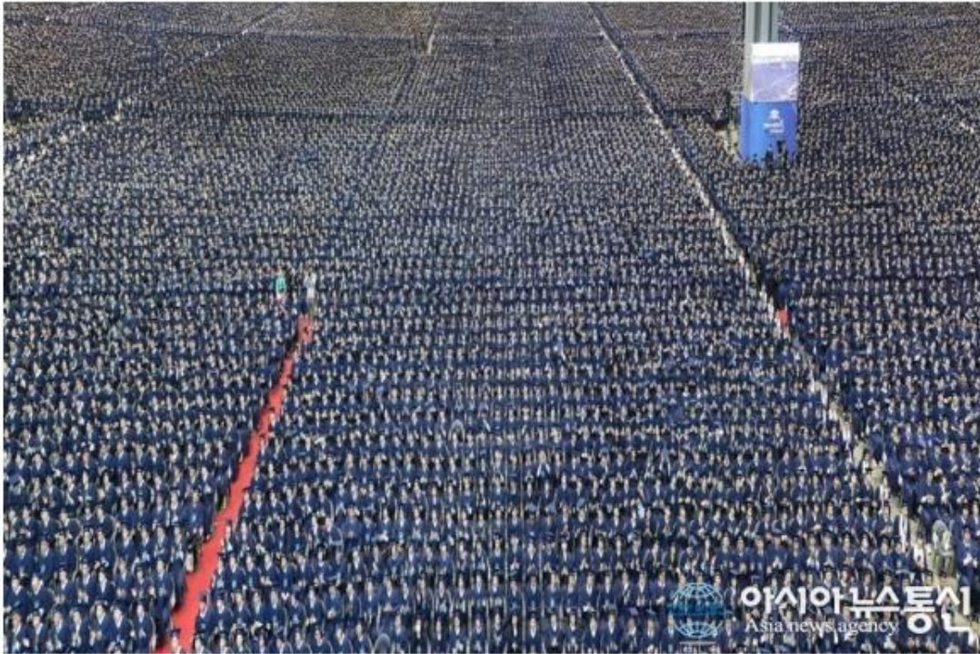
신천지예수교 10만 수료식.

신천지예수교회 관계자는 "전 세계적으로 10만명이 동시에 수료한다는 것은 전무후무한 사건이다"면서 나아가 "현재 20만명 이상이 이미 시온기독교선교센터 과정을 밟고 있다. 이 흐름대로라면 신천지는 앞으로 3년 안에 100만명 이상으로 성도수가 늘어날 전망이다"고 밝혔다.