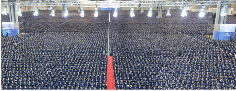
▲신천지 성도 10만 수료식 모습.

수료식은 신천지예수교회의 무료성경교육기관인 시온기독교센터의 6개월 과정을 마친 수료생들이 공식적으로 신천지예수교회의 새 신자로 정식 등록하는 절차를 의미한다.