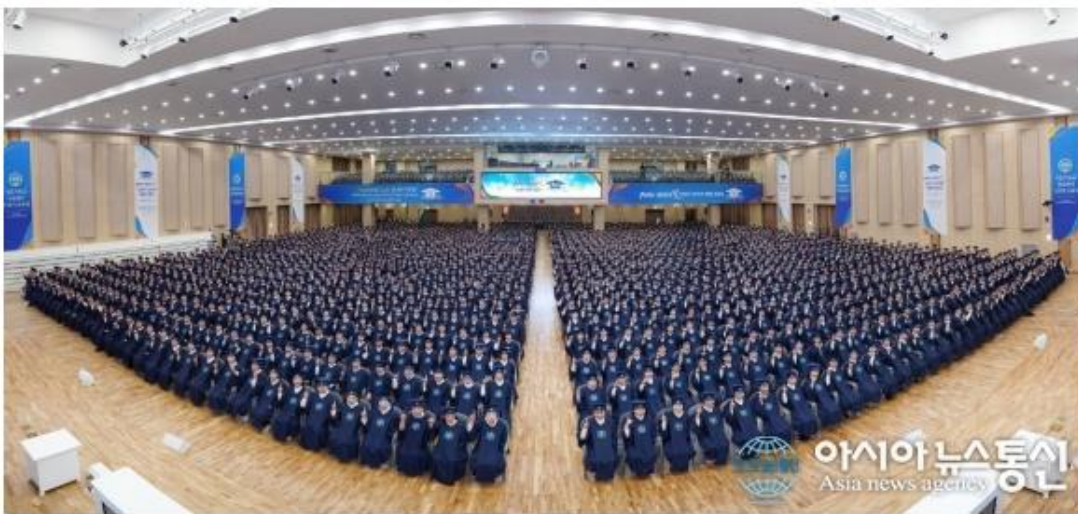
부산 지역 수료식 모습.

지난 1990년대 이후 기독교 교인 수가 급속도로 줄어들고 있는 상황에 견주어 보면 이러한 신천지의 성장은 국내 뿐 아니라 전 세계적으로도 유례가 없는 일이다. 이날 행사는 종교계의 지각변동을 예고했다.