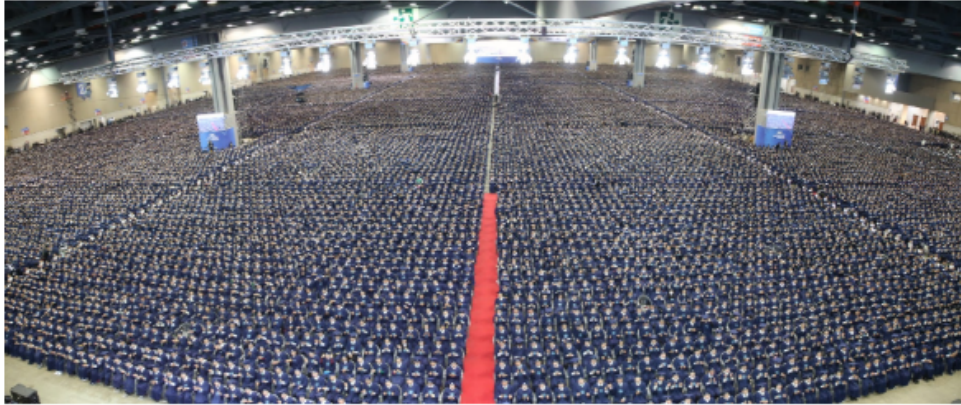
▲ 10일, 한국의 최대 실내 장소에서 가진 신천지예수교회 종교집회 장면.

신천지예수교 증거장막성전(총회장 이만희·이하 신천지예수교회)은 한국 개신교단 중의 한 교단이다. 이 교단의 교세증가는 가히 폭발적. 조용기 목사가 부흥시킨 서울 여의도순복음교회의 뒤를 이어 신천지예수교회의 교세가 날로 증가하고 있는 게 사실로 증명되고 있는 것. 신도세 증가 면에서 한국 개신교단의 혁명적 상황으로 평가될만 하다.