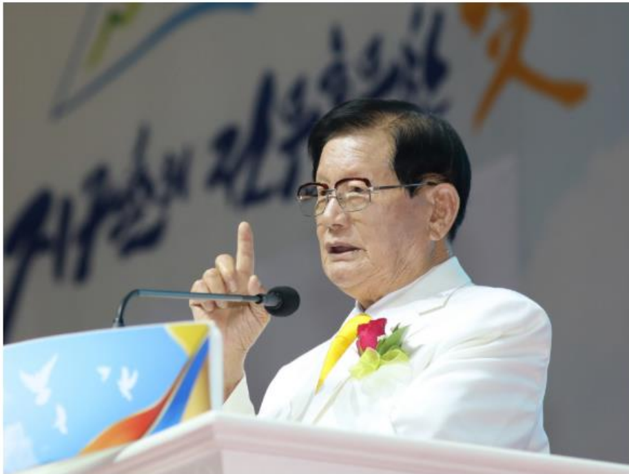
▲ 신천지예수교 증거장막성전 이만희 총회장의 설교 장면.

문일석 발행인 | 기사입력 2019/11/11 [16:32] ← 본문들기