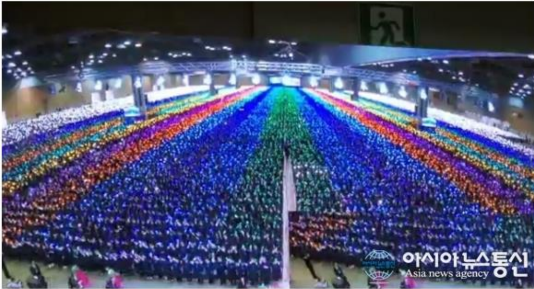
10만 수료생들이 불빛 퍼포먼스를 하는 모습.

수도권 지역에서 열린 '10만 명 수료식 현장'에는 6만여명이 참석했다. 수료식장 수용능력 부족으로 부산과 광주에서 나눠 진행된 가운데 부산 수료식 현장에만 7000여명이 참석했다.